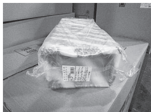
よく見かける定番のトレーです

川上：当社は社名からもわかるように、食品包装材の卸売り会社です。ケーホーソーの「ケー」は「川上の名前」と「京都」と「軽い」の頭文字から取りました。「ホーソー」は包装です。食品包装資材が主たる商品ですが、それ以外にも食品流通関係の企業が扱ういろいろなものを取り扱っています。