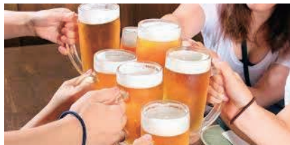
消費が盛り上がるか

昨今の労働者が抱える不満をうまいことガス抜きしつつ、経済団体の利益にしてやろうという姑息なやり方だ、という意見もある。こんなことより、長時間労働の是正と有給消化が先ではないか。2015年の調査によれば、世界の主要各国では年次有給休暇をほぼ100%消化するのが当然であるのに対し、日本の有給休暇消化率は60%とワースト2位だ。また、日本の労働者全体のおよそ6割が有給休暇の取得にためらいを感じているとの調査結果もある。また、日本は世界的にみても残業の多い国だ。男性正社員の1日の残業時間を比べると、サービス残業含まずに日本の数値は韓国の倍、フランスの3倍にもなる。長時間残業、有休未消化という問題が、個人消費をするための金銭的、時間的、精神的余裕を奪っている。ならばそれらを解決するのが最優先のとはずではないか。