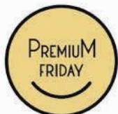
英文ロゴマーク(メイン)

もともと、プレミアムフライデーの原型といえるのが米国の「ブラックフライデー」だ。消費喚起を狙って米国の感謝祭（11月第4木曜日）の翌日から、小売店が一斉に値下げをしクリスマス商戦に向けたショッピングシーズンがスタートする。お隣の韓国でも、昨年消費低迷の打開策として韓国版ブラックフライデー「コリアグラントセール」に取り組んだ。大手百貨店などが中心となり、秋季セールの実施時期を前倒し、中国の大型連休「国慶節」にあわせて、10月1日から2週間実施された。参加店の売上高は前年同期比2割増と、一時的な消費活性化にはつながった。現地報道によれば、「セール＝値引き」で、企業にとっては利益率の低下など“負の側面”を指摘する声も聞かれる。